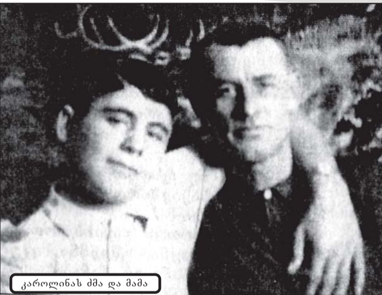
კაროლინას მამა და მამა

ამ ცოტა ხნის წინ ჩემს პირად არქივში ერთ საინტერესო მასალას წავაწყდი, წამსვე აღვიდგინე სტუმართმოყვარე, სათნო სახის ქალბატონი, რომლის ძარღვებში გერმანიის სისხლი ჩქეფს. ვკითხულობდი რა მის მიერ მოყოლილ ისტორიებს, ჩემთვის ვაკვირებდი, არავინ ვიცით წუთისოფელი თუ რას გვიმზადებს. ერთი ფრაზაც გამახსენდა „სადაურსა სად წაიყვან ბედო...“ დღევანდელი გადასახლებიდან საინტერესოც კი მეჩვენა ერთი ლამაზი გვარის ტრაგიკული ისტორია.