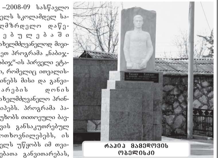
რაპინ მაჩხაიძის ობელისკი

„მართალია ბევრი რამ უნდა გააკეთო შენ კი შეიძლება ხისტი ხელები გაქვს, მაგრამ საქმეს ხელი მოჰკიდებ როგორც ჯერ არს და შედეგსაც კარგს მიიღებ, რადგან