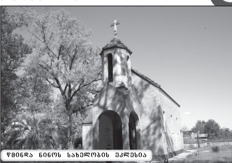
წმინდა ნინოს სახელობის ეკლესია