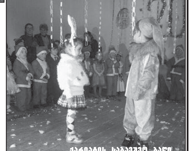
მარიამის საბავშვო ბაღი

„შობა გათენებულაო,“ „ქრისტეს მადლი ჩვენც გვწყალობდეს,“ „ალილო“ - ამ ნაცნობი გალობით ხმატკბილობდნენ პატარები. „დღეს ყველა ოცნება ნაძვის ხის ფერია“... ისმოდა სცენიდან და დასასრული არ უჩანდა მათ საახალწლო სურვილებს, ნატვრას, მოლოცვას. შთამბეჭდავი იყო სცენაზე ზამთრის პეიზაჟი-უხვად ცვიოდა „თოვლის ფანტელები,“