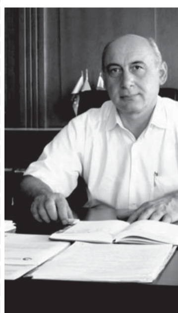
საზოგადოებასთან ერთად ერთი ვალდებულება გვაქვს

განსაკუთრებული აქტივობა გამოხატული კერძო ინვესტიციების შემოდინების კუთხით. ბოლო პერიოდ-