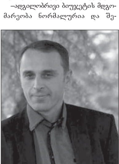
—ადგილობრივი ბიუჯეტის მდგომარეობა ნორმალურია და შე-

როგორ ანალიზს გაუკეთებდით, თქვენი მოსვლის შემდეგ, ადგილობრივი ბიუჯეტის მდგომარეობას, შეიცვალა თუ არა იგი 2013 წლიდან დღემდე, ციფრობრივი მაგალითების საშუალებით გვითხარით კლებულობს თუ მატულობს მუნიციპალიტეტის ბიუჯეტი?