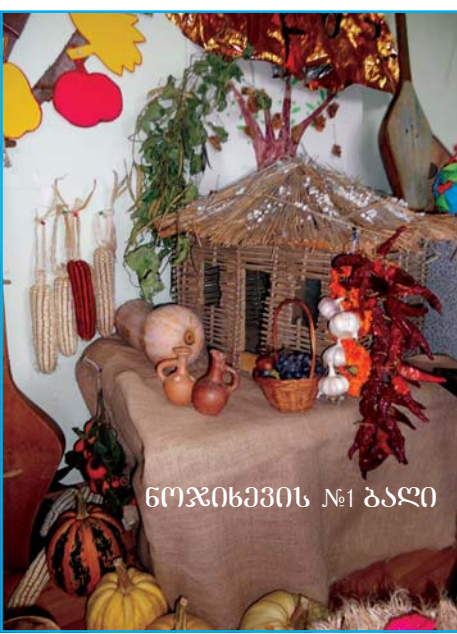
ნოჯიხევის №1 ბაღი

ნო ნოჯიხევის №1 და შუა ხორგის საბავშვო ბაღებში ჩატარებული ღონისძიებები. მაინც რა არის შემოდგომა? იკითხეს პატარებმა და 40 წუთიანი მუსიკალურ-მხატვრული კომპოზიციით თავადვე გასცეს პასუხი. „დასახლისის“ ფორმებში გამოწყობილი გოგობიჭები გოდრებით ხელში „ვენახისკენ“ მიემართებოდნენ, ყურძენს კრეფდნენ. საწინახელში ყრიდნენ და პაწია ხელებით წურავდნენ. მათ ბედნიერ სახეებზე ვარსკვლავით კიაფებდა თვალები. საოცრად ლამაზი და მომხიბვლელი იყო ყველაფერი. ლექსებს სიმღერები ცვლიდა, სიმღერას ცეკვები. დარბაზი გაალამაზეს ბავშვებმა, იყო ტაში, კისკისი, ხალისი. ასაკის შესასტყვისმა გემოვნებით შექმნილმა სცენარმა, პატარების მონაღობებამ და სურვილმა ღონისძიება უზაღო