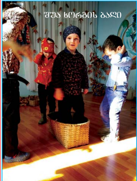
შუა ხორგის ბაღი

გახადა. ყვავილთა ჭკნობის, ფრინველთა გადახიზვნის და ზამთრის მოლოდინის გამო, ზეიმის შემდეგ ბუნების იდუმალი და მარადიული ცვალებადობის იმედით გაგებწყინდა და მოზეიმეთა სახეები. „მხოლოდ ცა არის უბერებელი“ გაუღერდა მხნედ, რაც კიდევ ერთხელ და მრავალჯერ დედაბუნების განახლება-გამოღვიძების მოწმეს გაგებხდის და ბევრ სიხარულს გვაჩუქებს.