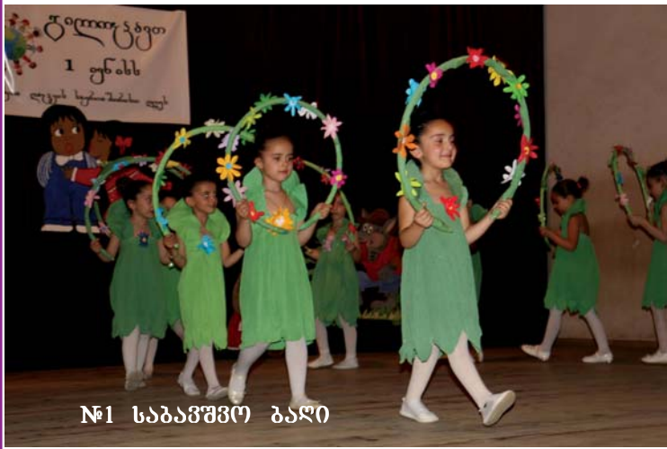
№1 საბავშვო ბაღი

მენლად ელიან თქვენთან შეხვედრას, რათა თავიანთი ცეკვებითა და სიმღერებით გაგვილამაზონ ისედაც ლამაზი და სასუკუარი დღე. ეს დღე თქვენია, ჩემო პატარებო, გილოცავთ!..