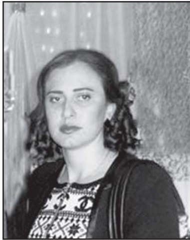
როგორ იყო გასული წელი თქვენთვის და თქვენი სოფლისთვის?

უპირველეს ყოვლისა, მივესალმები ჩვენი გაზეთის მკითხველს და ვუსურვებ ყოველივე კარგსა და ამაღლებულს.