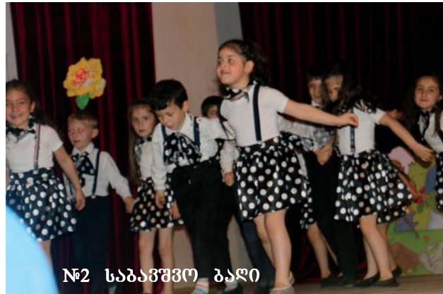
№2 საბავშვო ბაღი

ეს ცეცხლი აღარ განელდება, რადგან თქვენს წინაშე ცეკვით „ჩარგზია“ კვლავ წარსდგებიან ხობის №2 საბავშვო ბაგა-ბაღის აღსაზრდელები,-მოისმის წამყვანის ხმა და სცენა პატარებს დაეთმო. ულამაზესმა ბავშვებმა მართლაც ცეცხლი დაანთეს. შემდეგ, უმშვენიერესი ფორ-