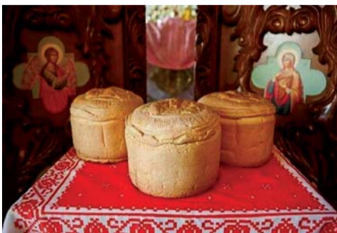
მას უზმოზე, ღოცების წარმოთქმის შემდეგ იღებენ.

ქრისტე აღდგა! ჭეშმარიტად აღდგა!-ასე ესალმებიან ერთმანეთს ქრისტიანები ადგომიდან ამაღლებაში, 40 დღის განმავლობაში და ამით იმ ნეტარ 40 დღეს აღნიშნავენ, მკვდრეთით აღდგარმა იესომ რომ გაატარა თავის მოწაფეთან.