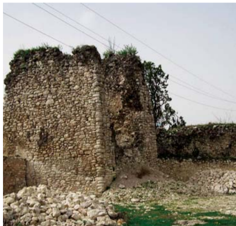
ხეთას ციხე (ხამისკური).

ზემო ბიის წმინდა მთავარანგელოზთა სახელობის ეკლესია (ბია).