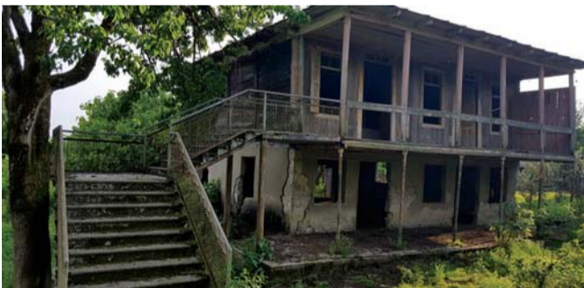
ზვიად გამსახურდიას მემორიალური სახლი (ძველი ხიბულა).