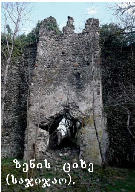
ზენის ციხე (საჯიჯაო).