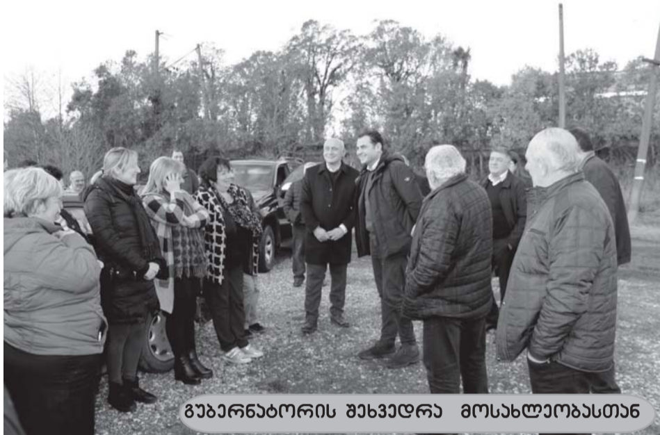
გზაპროექტის განხორციელებისთვის მოსახლეობასთან

120 ბენეფიციარი; სარეაბილიტაციო, 100 წელს გადაცილებულ 3 ქალბატონს პირად ანგარიშზე ჩაერიცხა 150-150 ლარი; უმწველ კატეგორიის 160 ოჯახს, წყლის საფასურის სუბსიდირებისთვის ჩაე-