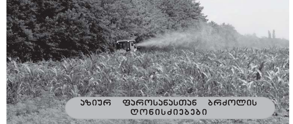
ახიურ ფაროსანასთან ბრძოლის დონისძიება

სპორტის პოპულარიზაციამ გამოიწვია ის, რომ ჩვენს მუნიციპალიტეტში გაიზარდა მძლეოსნობით დაინტერესებული ახალგაზრდების რიცხვი. შეფასებული მდგომარეობის შედეგად ჩვენს მუნიციპალიტეტში მძლეოსნობის ეროვნულ ფედერაციასთან გაფორმდა ურთიერთანამშრომლობის მემორანდუმი, რის საფუძველზეც გაიხსნა ძალოსნობის წრე ჭალადიდის ადმინისტრაციულ ერთეულში. ძალოსნობის ფედე-