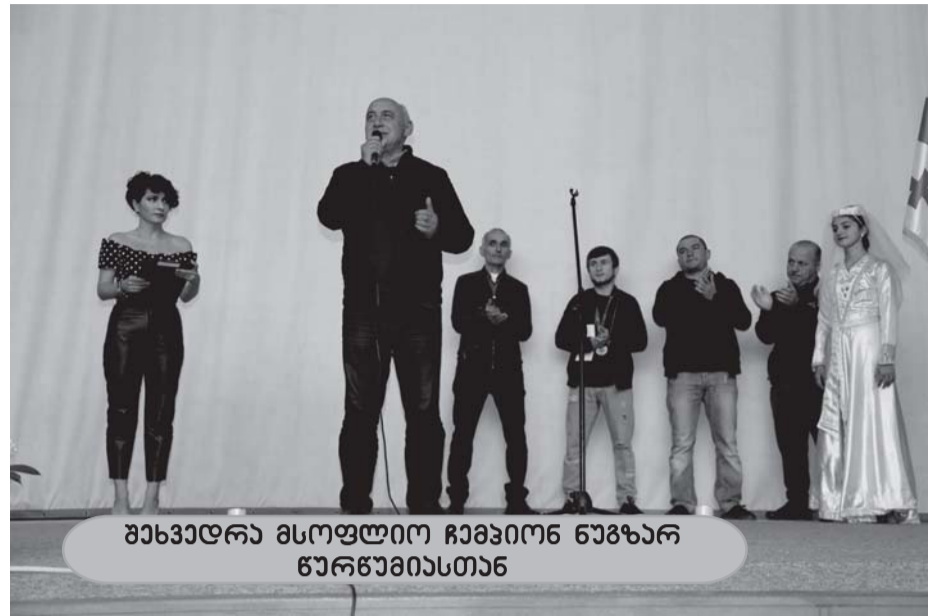
მხსენებელი მსოფლიო ჩემპიონ ნაზარ წარწმინასთან

გარდა მერიის სამსახურების მიერ განხორციელებული, ანგარიშში ჩამოთვლილი საქმიანობისა, მათ კომპეტენციას მიეკუთვნება მუნიციპალიტეტის მიერ დაფუძნებული იურიდიული პირების საქმიანობის კოორდინირება და კონტროლი, რომლის ფარგლებშიც 2018