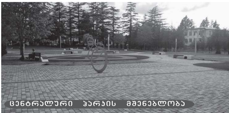
სენბრალური პარკის მშენებლობა

ლევის ადმინისტრაციულ ერთეულში წყალსადენი ქსელის მოწყობის სამუშაოები—302,0 ათასი ლარი;