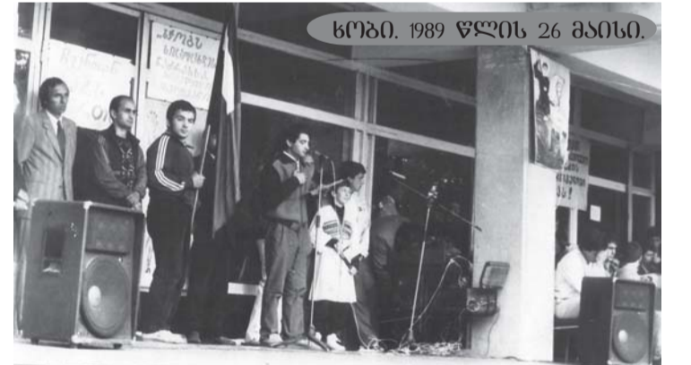
სტობი. 1989 წლის 26 მაისი.

მიუხედავად „კონგრესმენტა“- ბოიკოტისა, ზვიად გამსახურ- დიამ აიძულა კომუნისტური რეჟიმი დაენიშნა მრავალპარ- ტიული არჩევნები, რაც ამავე წლის 28 ოქტომბერს „მრგვა- ლი მაგიდა თავისუფალი სა-