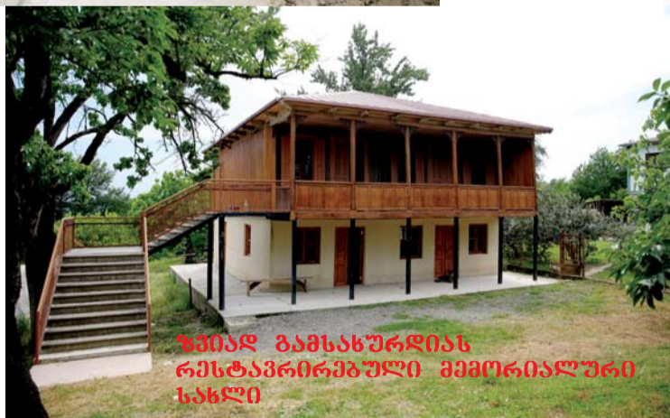
ზემიად გამსახურდიას რესტავრირებული კამორიკალური სასლი