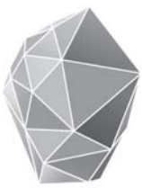
საქართველოს ინოვაციების და მენეჯმენტის სააგენტო

სობის კულტურის სახლის მცირე დარბაზში, რეგიონში დაგეგმილი საგანმანათლებლო პროექტის, ტრენინგ კურსის „დაიწყე და განავითარე შენი ბიზნესი“ შესახებ საინფორმაციო სახის შეხვედრა გაიმართა.