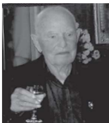
სამამულო ომის პირველმა ზაფხულმა სამგლოვიარო ზარით ამცნო ქვეყანას თავისი მობრძანება. ცა შავი ღრუბლებით აიბურა და ჭექა