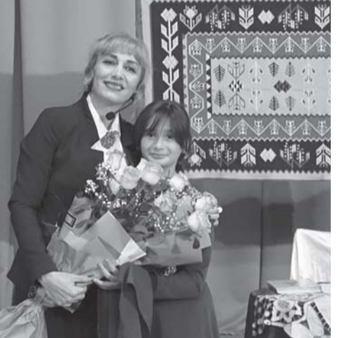
დიდხანს ისმოლეს მათი პანგები ჩვენს კუთხეში.